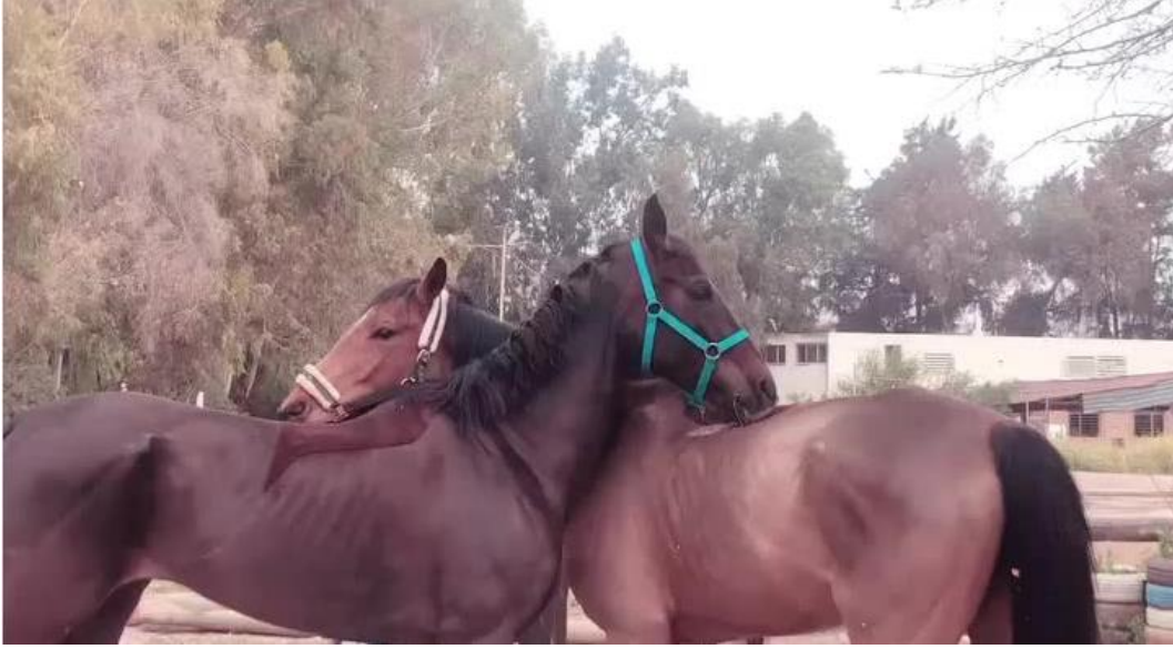
Şekil 1. Padokta birbiri ile iyi anlaşılan atların iletişim ve arkadaşlık davranışları

bir inceleme yapıldığında yaşın bir etkisi bulunamamıştır. Fakat çalışmada kullanılan at sayısının artırılmasıyla daha net bilgilere ulaşılabileceği düşünülmektedir.